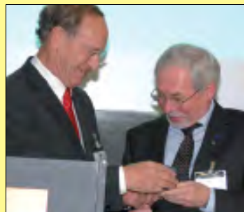
Ehrennadel für besondere Verdienste um die GDL